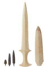
磨制石剑和石镞 咸平德林里白羊支石墓 | 青铜器