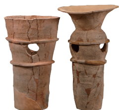
圆筒形陶器 光州月桂洞1号墓 | 三国