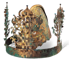
金铜冠 国宝 | 罗州新村里9号墓 | 三国

展览空间介绍了以荣山江流域为中心形成的独特的古代古坟文化。可以了解荣山江流域古人埋葬死者、祈求死后永生的古坟文化。展览室分为<瓮棺室>和<古坟遗物室>。<瓮棺室>分为瓮棺室、罗州伏岩里3号墓室和新村里9号墓室金铜冠室。瓮棺室展示80多口大型瓮棺，展示着随着时间的推移而发生的变化。墙上放映着以‘永恒的休息’为主题的媒体艺术视频，参观者可以在参观瓮棺的同时欣赏视频。在罗州伏岩里3号墓室，可以看到瓮棺在百济的影响下发生的变化，在新村里9号墓室金铜冠室，展示着带有出土金铜冠的瓮棺，参观者可以感受瓮棺的地位。<古坟遗物室>介绍了从古坟中出土的铁器、珠子、土器等各种陪葬品，以及它们用于与外界交流的方式。