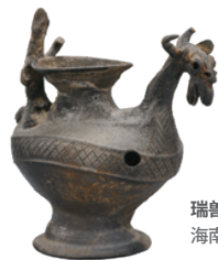
瑞兽形陶器 海南万义塚1号墓 | 三国