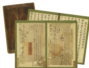
壬乱捷报书目 宝物 | 崔希亮(1560~1651) | 1598年 朝鲜