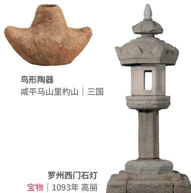
鸟形陶器 咸平马山里杓山 | 三国